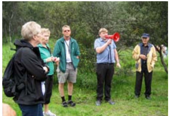
Georg formaður þakkar móttökurnar í Básum í Goðalandi.

Eyjafjallajökull er eldkeila og rís hæst 1.666 metra yfir sjó. Síðast gaus úr jöklinum 1821-23. Flóð braust fram undan skriðjökli úr norðanverðum jöklinum. Það stóð aðeins yfir í 3