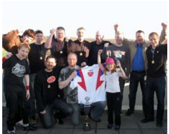
Lið Litlaprents sem sigraði Knattspyrnumót FBM 2010.