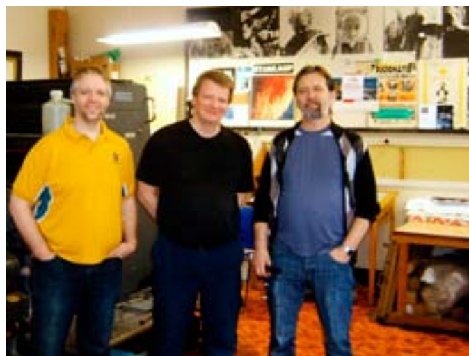
Starfsfólk Prentsmiðjunnar Eyrúmar í Vestmannaeyjum