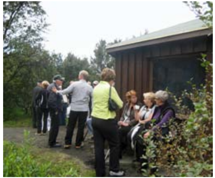
Beðið eftir grillveislu í Básun.

lengra. Þar var sest að kvöldverði, í forrétt var afar girnileg fiskisúpa með humar og rækjum og fiski. Aðalrétturinn var íslenskt lambakjöt, afar ljúffengt.